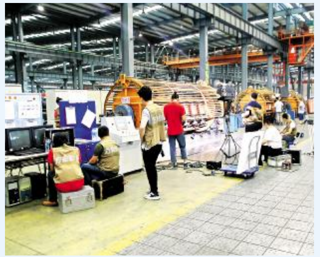
摄制组在生产现场