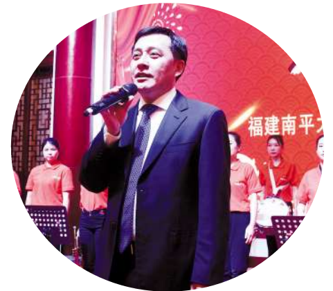
南平市長劉洪建發表講話