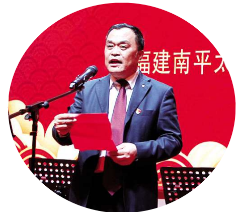
南平市副市長黃蘇福發表講話